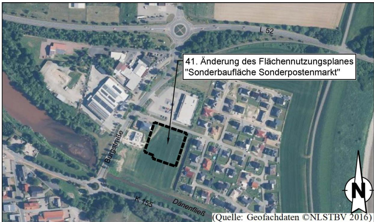
Abbildung 2: Lage im Raum (unmaßstäblich)

Der Änderungsbereich liegt nördlich des Ortskern der Gemeinde Rhede (Ems) östlich der Burgstraße und nördlich der Kreisstraße 155.