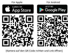
(Kamera auf den QR-Code richten und Link öffnen)